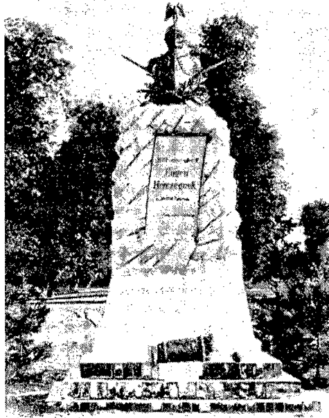
Eugen emlék a szigeten.

dicssel, mint régebben, minden évben megtartatnak... " 3 Ezekről számos színes, vídám tudósítást olvashatunk a régi zentai újságokban.